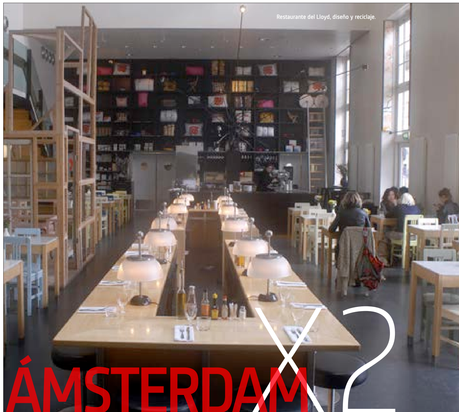
Restaurante del Lloyd, diseño y reciclaje.

Hotel Lloyd & Cultural Embassy Oostelijke Handelskade, 34 1019 BN Amsterdam. T. (+31 20) 561 3608. lloydhotel.com