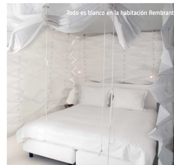
Todo es blanco en la habitación Rembrandt.