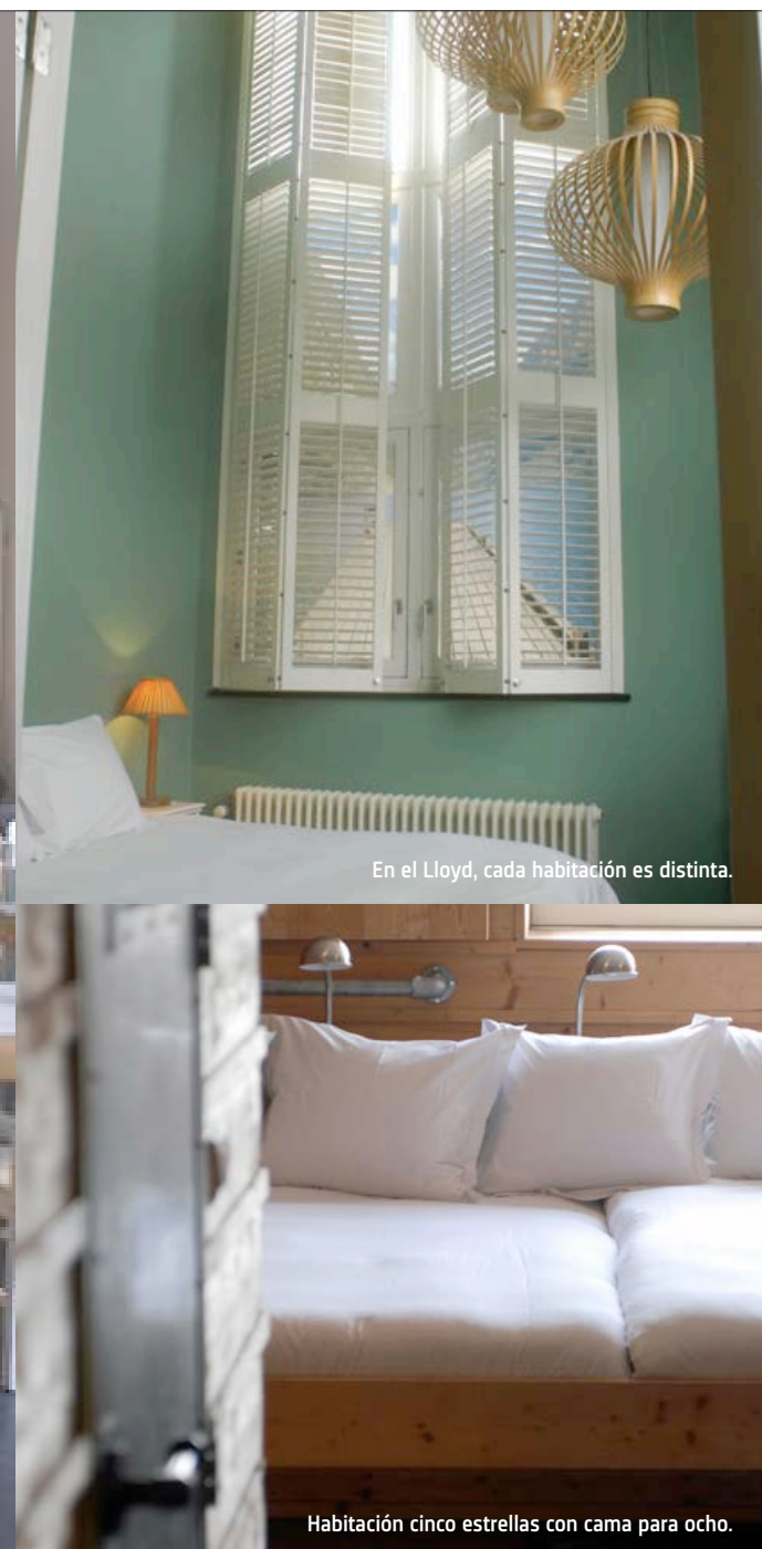
En el Lloyd, cada habitación es distinta.